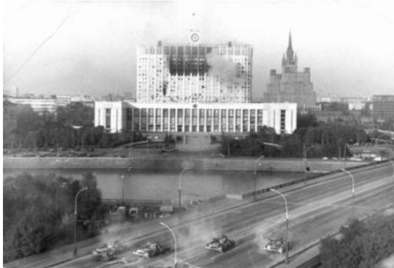
Здание Верховного Совета после обстрела 4 октября 1993